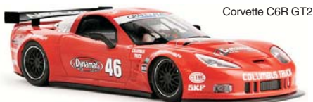
Corvette C6R GT2