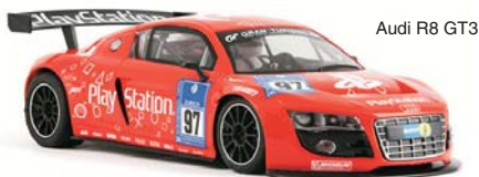
Audi R8 GT3