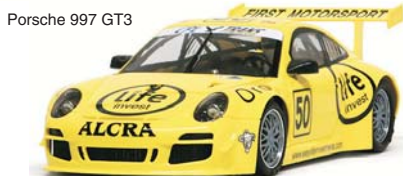
Porsche 997 GT3